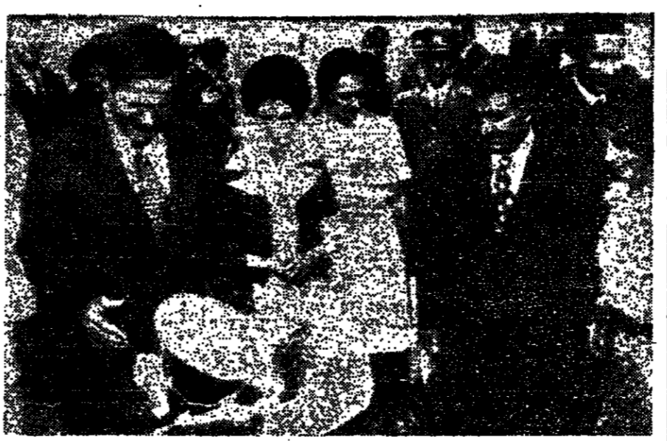
בכאן משה האפו אסד ואשתו אמיט (שמאל) מקבלים פרסים ברגלים ביום כי לביקור בבוקארשט. מימין נכדו רומניה מר ניקולא צ'אושקו ואשתו אלמנה (ימין)